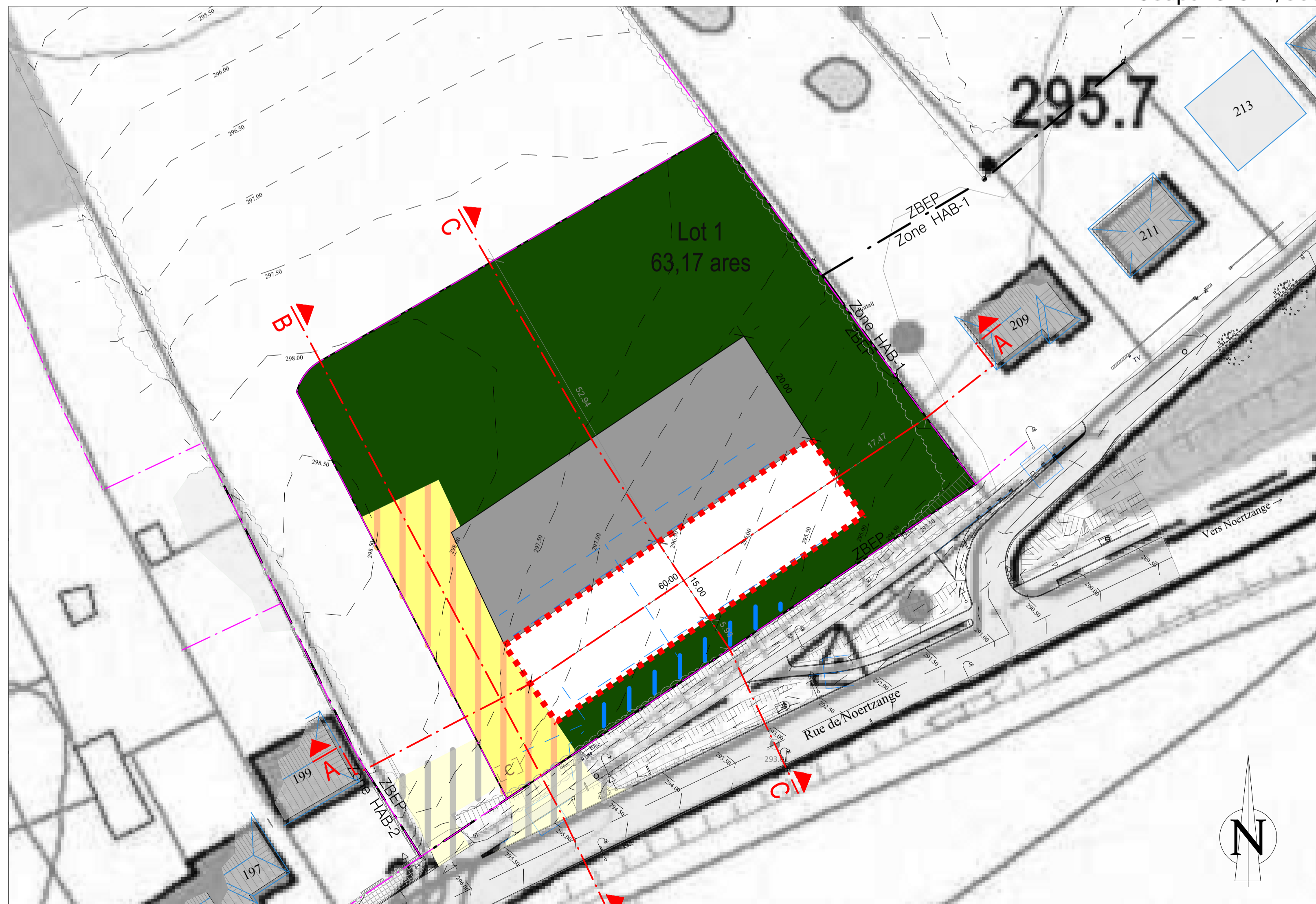
Projet d'Aménagement Particulier 1/500