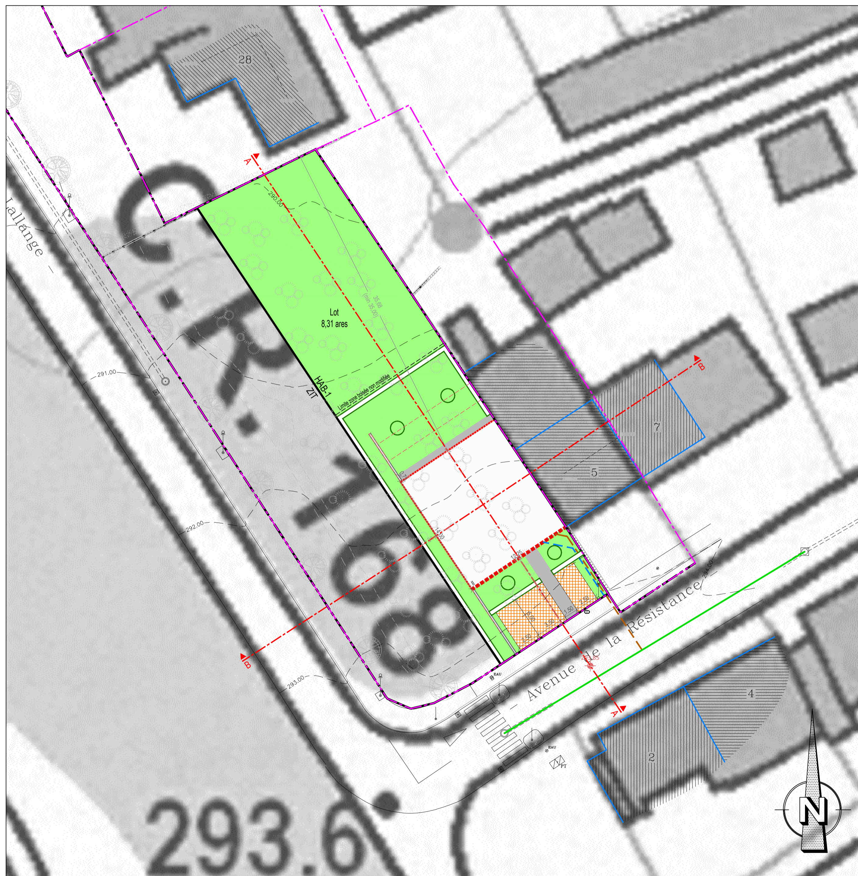
Projet d'Aménagement Particulier 1/250