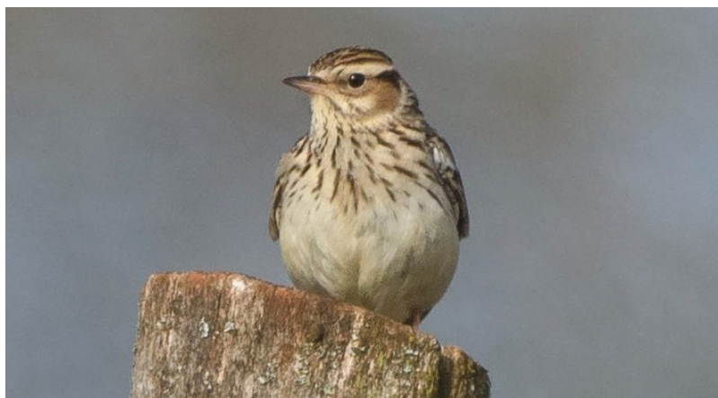
▲ L'alouette lulu est un oiseau rare qui dépend des pelouses sèches du Lalléngerbiérg.

Mais le Lalléngerbiérg est aussi un site d'une richesse naturelle exceptionnelle. Par conséquent il est protégé au niveau européen (site Natura 2000 depuis 2004) et au niveau national (réserve naturelle depuis 2016). Depuis 2020 il fait partie des zones centrales de la Minette UNESCO Biosphère. Le site héberge de vastes pelouses sèches qui constituent des habitats pour une multitude d'espèces rares protégées dont orchidées, papillons, reptiles et oiseaux. Parmi les oiseaux c'est surtout l'alouette lulu (DE: Heidelerche; LU: Bëschléierchen) qu'il convient de mettre en avant.